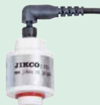
インライン測定用パッフル: BF-JK ※チューブ継手は、含まれません。