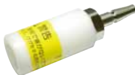
アウトレット用アダプタ