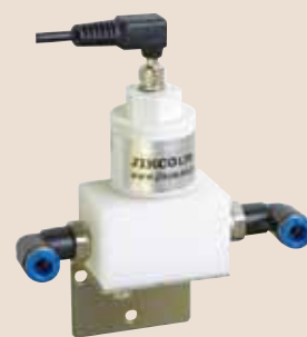
インライン測定用パッフル：BF-JK ※チューブ継手は、含まれません。